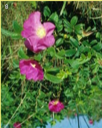
Die Karthoffelrose ist in den strandnahen Weißdünen zum Problem geworden, da sie sich stark ausbreitet und die heimische Vegetation verdrängt.

Redaktion, Grafik und Herstellung Planungsbüro Mordhorst-Bretschneider GmbH, Kolberger Straße 25, 24589 Nortorf