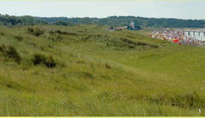
Strandleben am Naturschutzgebiet

Die im Südosten der Hohwachter Bucht gelegene „Weißenhäuser Brök“ ist eines der größten Dünengebiete an der schleswig-holsteinischen Ostseeküste. Bereits 1942 wurden 57 ha dieser einzigartigen Dünenlandschaft als Naturschutzgebiet ausgewiesen.