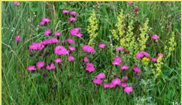
Heide-Nelke mit gelb blühendem Echten Labkraut.

Bemerkenswert sind hier die Vorkommen der in Schleswig-Holstein vom Aussterben bedrohten Arten Kleine Wiesenraute und Großer Knorpellattich. Innerhalb des Dünengebietes ist die starke Ausbreitung der landschaftsfremden Kartoffelrose ein Problem. Sie wurde zum Küstenschutz angepflanzt, verdrängt jedoch zunehmend die schützenswerte Dünenvegetation. Erste Erkenntnisse über die Tierwelt belegen die außerordentlich hohe Bedeutung der Trockenlebensräume für wirbellose Tiere wie Käfer, Wildbienen, Grabwespen, Spinnen und Heuschrecken. So sind z.B. die Heiden besonders für blütenbesuchende und pflanzenverzehrende Insekten von großer Wichtigkeit.