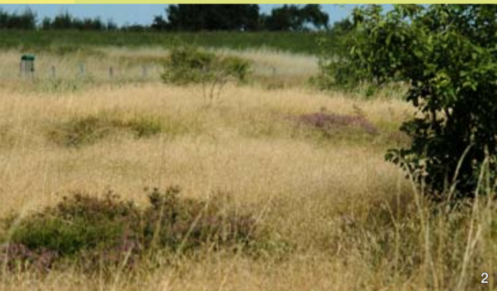
Die Braundüne setzt sich auch hinter dem Landesschutzdeich bis an den Ferienpark heran fort und ist von einer vergrasteten Heide besiedelt.

Dieses Falblatt wird im Rahmen des Besucherinformationssystems für die Naturschutzgebiete in Schleswig-Holstein herausgegeben und kann beim Landesamt für Natur und Umwelt des Landes Schleswig-Holstein, Hamburger Chaussee 25, 24220 Flintbek, angefordert werden. Tel. 04347 - 704-230, E-Mail: broschueren@lanu.landsh.de